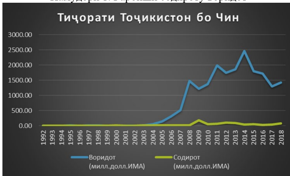
Намудори 1. Гароиши содироту воридот

Дар намудори 1 дида метавонем, ки агар то соли 2004 содироту воридот аз якдигар фарқияти баланд надошта бошанд, аз соли 2005 воридоти мо аз Чин бо суръат боло рафтааст. Садирот ба ин кишвар аз Тоҷикистон натавонистааст бо ҳамон суръат боло равад. Танҳо дар солҳои 2008-2009 камтар пешравии назаррасро дида метавонем. Вале пас аз сар задани бӯҳрони молиявии ҷаҳонӣ боз рӯй ба поён овардааст. Баландтарин адад дар воридоти Тоҷикистон аз Чин ба соли 2014 рост меояд, ки он 2 468 миллион доллари ИМА-ро ташкил мекунад. Садирот бошад дар соли 2008 аз ҳама баландтар буд ва он ба 185 миллион доллари ИМА баробар буд. Дар намудори 2 гароиши гардиши умумии молу маҳсулот миёни ду кишвар нишон дода шудааст.